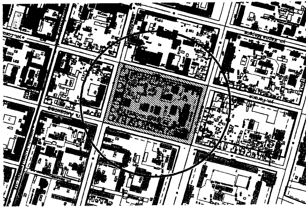
СХЕМА РАЗМЕЩЕНИЯ ОБЪЕКТА

к решению Совета городского округа город Уфа Республики Башкортостан от «18» июня 2014 года № 33/12